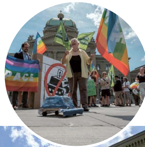
L'ambiance était bonne au moment de déposer l'initiative en juin 2018.

La Fondation Abendrot se concentre systématiquement sur des projets durables et renonce également, outre le matériel de guerre, à investir dans des domaines qui entraînent la destruction de l'environnement ou la violation des droits de l'homme. La Fondation réussit très bien sur la base de son catalogue de critères sévères: elle gère des actifs de près de 1,9 milliard de francs et a réalisé au cours de l'exercice précédent un rendement de 7,46 %. La démonstration est donc faite qu'il est possible d'obtenir sans problème une rente sûre avec des investissements responsables sur les plans social et écologique.