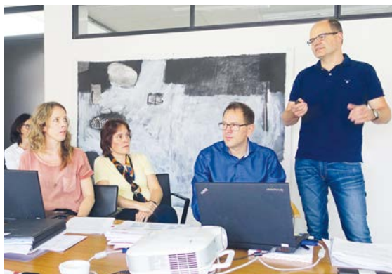
Le Service Titres en réunion

été gestionnaire de portefeuille responsable de tous les mandats asiatiques chez UBS à Singapour, puis, après un détour comme Chief Investment Officer chargé des actions asiatiques auprès du Fonds étatique ADIA à Abou Dhabi, est rentré en Suisse avec sa famille en 2007. Depuis, il travaille à son compte dans sa société bestideasgroup AG et accompagne différentes entreprises suisses de prévoyance, notamment la Fondation Abendrot. Après des années passées dans le secteur financier, il est heureux de mettre son savoir au service d'une institution de prévoyance sympathique et soucieuse de durabilité.