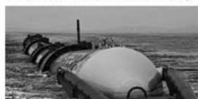
Das Hauptquartier der Stiftung Abendrot in Winterthur.

Am 9. März 2011 erschien eine Publireportage über die Pensionskasse Stiftung Abendrot. Die Botschaft, was Abendrot vor anderen Kassen unterscheidet, ist diesem Beitrag getreu so dargestellt, wie Abendrot dies Alterskapital seiner Versicherten 014 56, CHF je Jahr 2010 erhält.