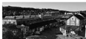
Das Hauptquartier der Stiftung Abendrot in Winterthur.

Wenn es Ihnen nicht egal ist, wo Ihr Alterskapital angelegt wird, schauen Sie sich in Ihrem Geldbeutel die Stiftung Abendrot an. Denn hier sehen Sie, dass es auf dem Lagerplatzareal in Winterthur interessante Entwicklungen ermöglicht.