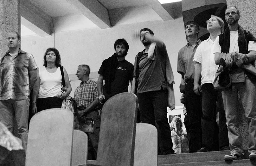
Abendrot-Delegierte bei der Besichtigung des Goetheanums.

lementsänderung ab 2007 die Möglichkeit schaffen, dass die Rentenkürzung durch zusätzliche Einlagen verkleinert oder gänzlich ausgekauft werden kann.