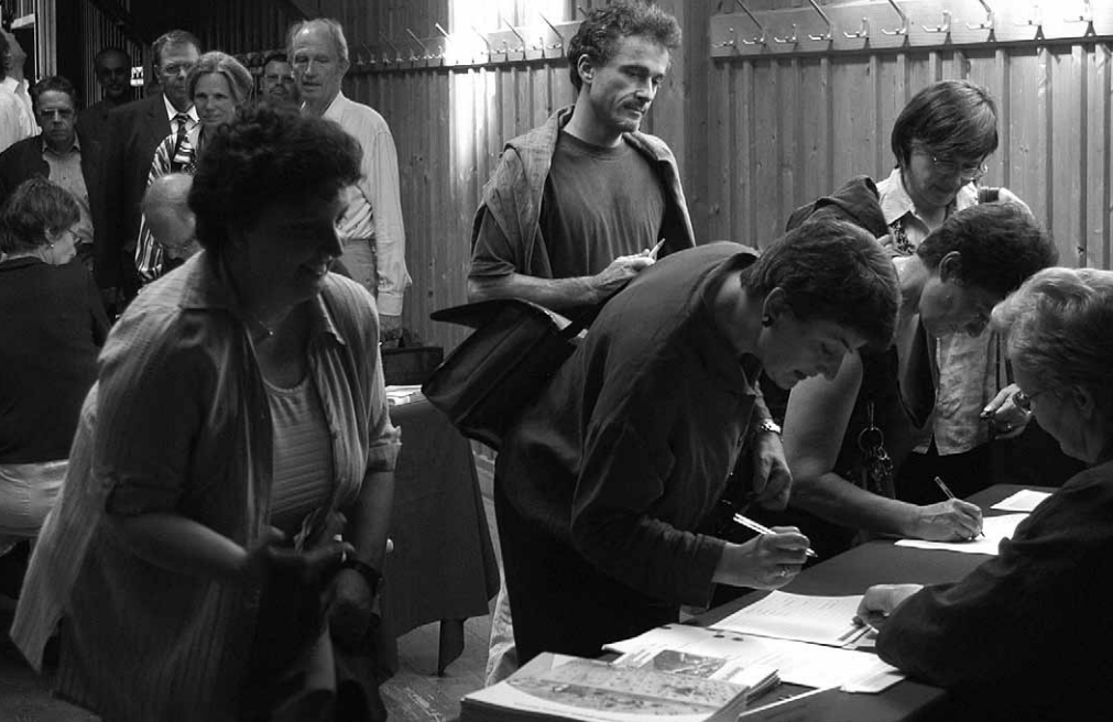
An der Delegiertenversammlung nahmen 150 Delegierte aus der ganzen Schweiz teil.

wirtschaft und die Steiner-Schulen. Weniger bekannt dürfte sein, dass am Goetheanum und in den verwandten Unternehmen der Region wie den beiden Kliniken, in den biologisch-dynamischen Landwirtschaftsbetrieben, heilpädagogischen Einrichtungen oder bei Weleda in der Region von Dornach rund 1000 Personen arbeiten und dass Mitte der 90er-Jahre diese Mitarbeiter einen Umsatz von 150 Millionen Franken generierten, wobei davon gut 67 Millionen Nettozufluss in die Region Dorneck waren.