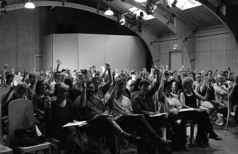
150 délégués furent présents à la manifestation informative de Dornach.

anticipée, enfin versement comptant d'avoirs de caisse de pension lors de départs pour l'étranger.